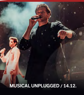
MUSICAL UNPLUGGED / 14.12.

Sie sind mindestens 18 Jahre alt und suchen einen besonderen Nebenjob? Dann werden Sie doch sogenannte Poolkraft im theater itzehoe auf Minijob-Basis . Wir beschäftigen während der Spielzeit von September bis Juli – ein Einstieg ist jederzeit möglich – Menschen, die fürs Theater brennen und in folgenden Bereichen gerne mitarbeiten möchten: Sie mögen den Kontakt zu Menschen, dann sollten Sie sich für die Mitarbeit im Theaterfoyer bewerben. Sie arbeiten gerne auch an der frischen Luft, hängen Plakate an Stellflächen und in den Schaukästen des Theaters aus, übernehmen Botengänge? Dann ist ein Nebenjob im Marketing genau das Richtige für Sie. Wir freuen uns auf Ihren Anruf unter (0 48 21) 67 09 0.