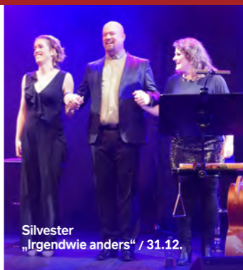
Silvester „Irgendwie anders“ / 31.12.