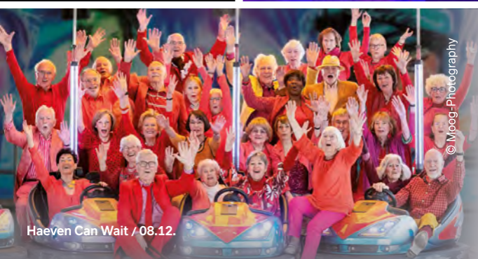
Heaven Can Wait / 08.12.